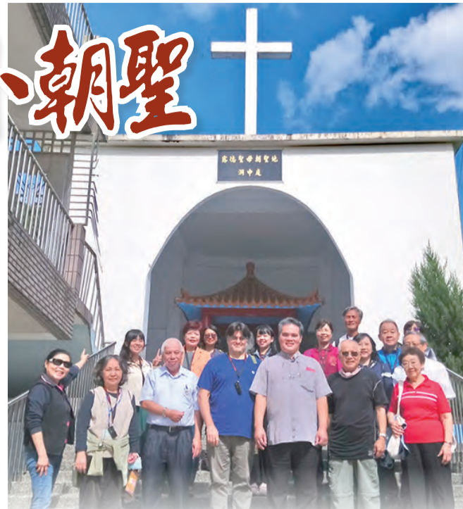
▲參訪基隆四腳亭的露德聖母朝聖地，在新近落成啟用的聖母洞中亭前留影。