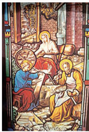
▲彩色玻璃聖像畫中深具生活動態的聖家圖，充滿慈愛與溫暖。