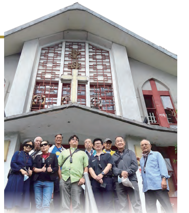
▲淡水法蒂瑪聖母朝聖地每年都有九日敬禮，當地居民也十分熟悉聖母遊行活動。