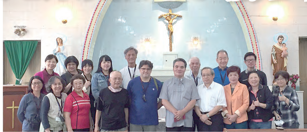
▲四腳亭露德聖母朝聖地歷史悠久，在日治初期就從台北來此開教。