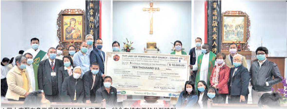
▲眾人齊聚在象徵愛德活動的超大支票前，紀念有情有義的共融時刻。