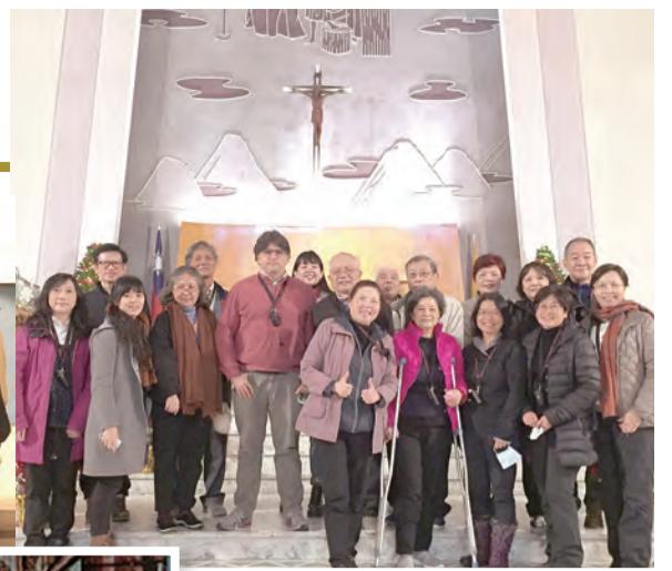
▲參訪神學意涵豐沛的聖家堂，也是全台最大的天主堂，學員們收穫良多。

總之，每位參訪者都對所去過的教堂有相當深入的認識，而不是只作為朝聖中途的休息站，對所有去參訪的教堂而言，我們所抱持的心態都是「歸人」，而非「過客」；在上主的聖殿中，是多麼美妙。本次活動的一個特色是我