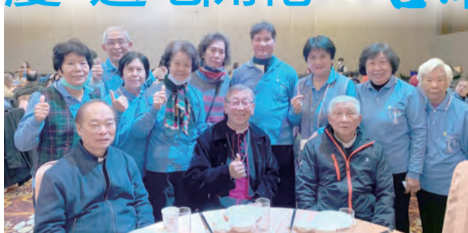
▲榮休林吉男主教（前排右）、李若望主教（前排中）蒞臨參加慶祝聖母軍在台70周年遍地開花感恩餐會。

午餐後，車行至坐落於菁寮鄉間的聖十字架天主堂，庭園內花木扶疏，四座指向天際的高聳尖塔是聖堂特色，塔尖處各有一個象徵性的聖物，如鐘樓上方的公雞，象徵基督受難、悔改和復活的意義；洗禮堂上方的鴿子，象徵聖神降臨；聖殿上方的十字架，沈穩壯麗的外觀，展現天主的救贖；聖體堂上方的皇冠，象