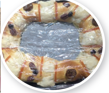
▲藏有耶穌的墨西哥麵包