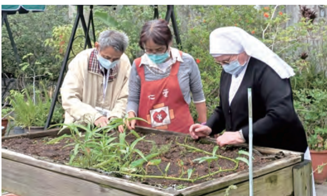
▲耶穌肋傷會裴嘉妮修女（右）陪伴仁愛服務對象學習種菜。

工作地點：台北 意者請將履歷寄至 catholics30@yahoo.com.tw 我們將主動與您聯繫。