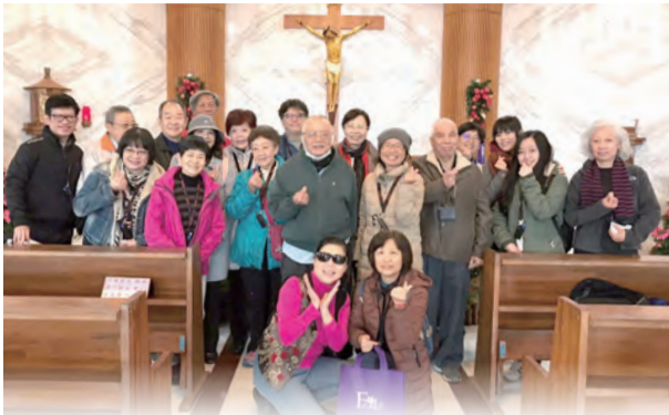
▲參訪礁溪五峰旗聖母朝聖地，對聖母顯靈幫助山友平安下山的事蹟，留下深刻印象。