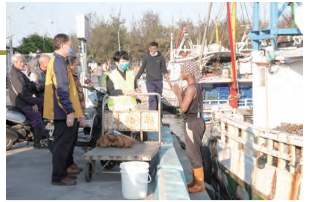
▲蘇耀文主教（左）帶著志工們前往梧棲漁港漁船休息區發送物資及表達祝福，收受餽贈漁工雙手合十，表達心中感激。

蘇主教感動地表示：「謝謝航港區給予這樣的肯定，為黃秘書的付出是很大的鼓勵，她總是盡心盡力協助溝通與安撫船員，並在祈禱中