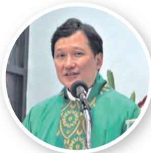
▲教廷代辦佳安道蒙席嘉許長安堂的愛德行動