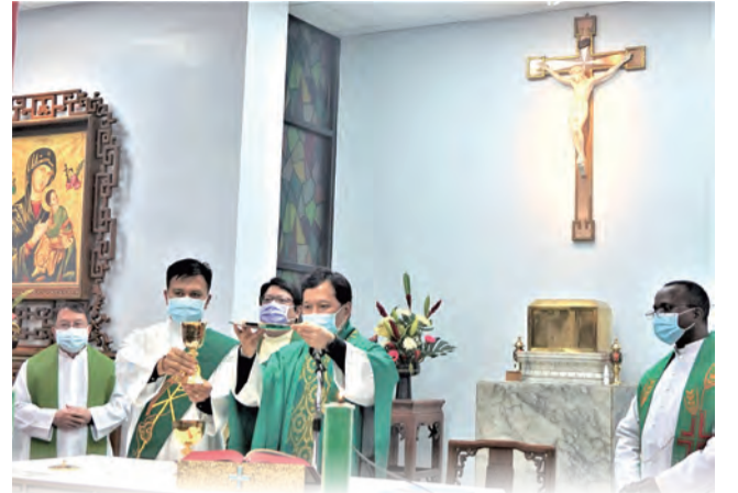
▲教廷代辦佳安道蒙席主禮感恩彌撒，許德訓、王佳信等三位神父及執事共祭。