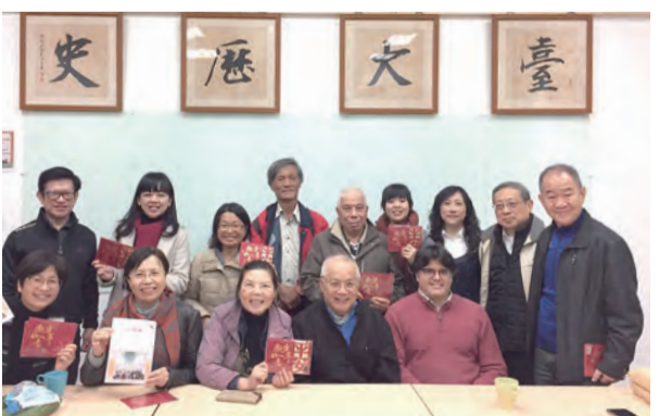
▲在台大歷史系會議室，師生進行結業綜合座談，分享豐富美好的課程心得。

最先參觀的是位於民生西路的台北總教區主教座堂——聖母無原罪主教座堂，算是台灣天主教會最早的一個旗艦；由當年的蓬萊町天主堂原址重建而成，開始依梵二大公會議的精神，簡化堂內的裝飾，堂中無染原罪的聖母抱子態像很突出。順道也參訪就在附近1916年成立的百年學府台灣第一所女子學校——靜修女