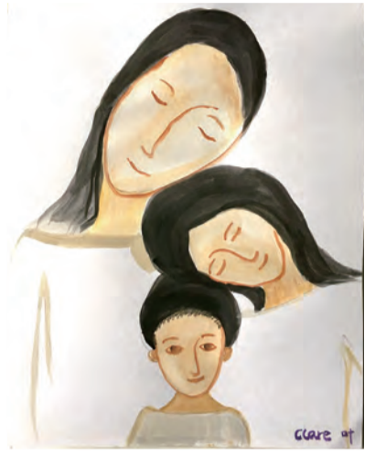
▲葉佳艷老師彩繪的聖家畫作, 細膩不失純淨, 十分傳神脫俗。

在此提供婚前培育課程的綱要: (1) 培訓分享夫婦: 召喚有使命感的分享夫婦是婚前培育工作的重要關鍵, 他們願意經由不同的主題分享他們的婚姻感人史, 協助準夫婦們在進入婚姻生活前有更好的準備。(2) 團體互動: 準夫