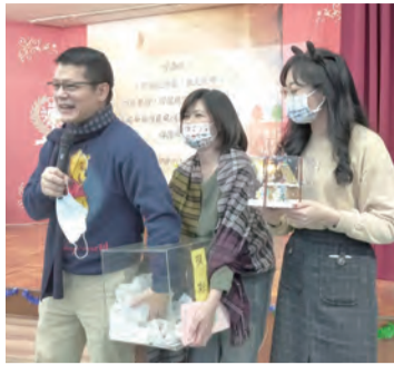
▲神父為大家摸彩抽出幸運兒