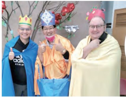
▲按墨西哥傳統三王來了發禮物