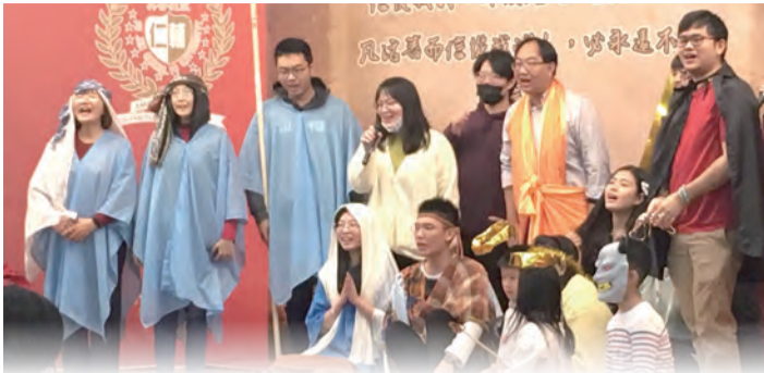
▲牧羊人幾經試探，終於找到剛出生的小耶穌。