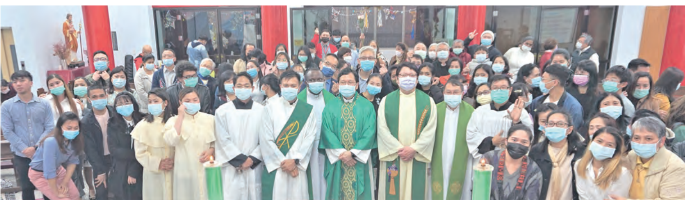
◀感恩祭後歡喜大合照

(MARAMING SALAMAT PO!) 以宿霧的語言是：「願天主降福大家！」In Bicol Naga dialect「Dios Mabalossaindogabos」